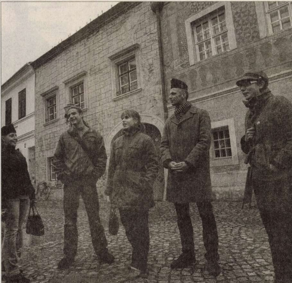
A kőszegi Ottlik-kultusz évek óta eleven: „Medve-sapós” gyakorlatok 2009-ből, a Sgraffitós-háznál

És bár azóta olyan (gyönyörű) elemzések is születtek, amelyek azt bizonyítják, hogy az Ottlik-életmű éppen nem a „minden megvan” biztonság-